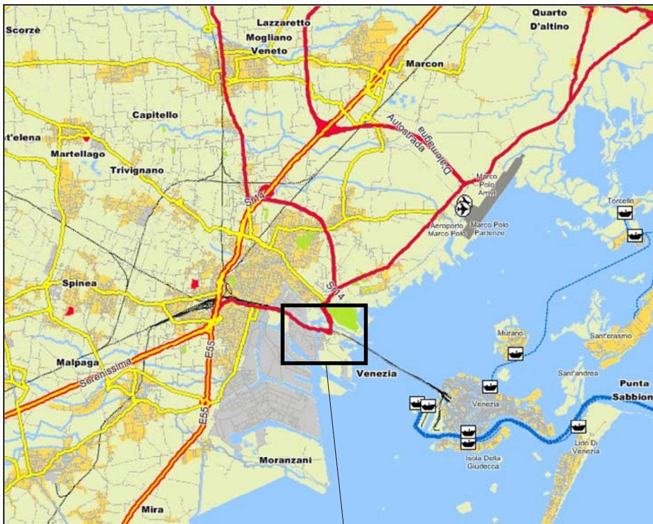
Dettaglio logistica zona check-in ZTL BUS